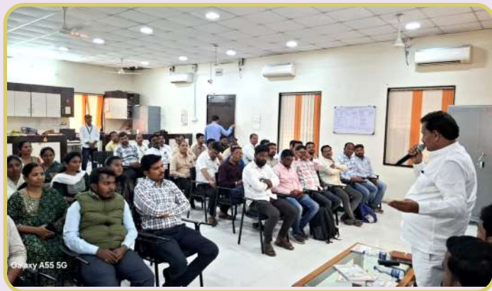
Galaxy A55 5G