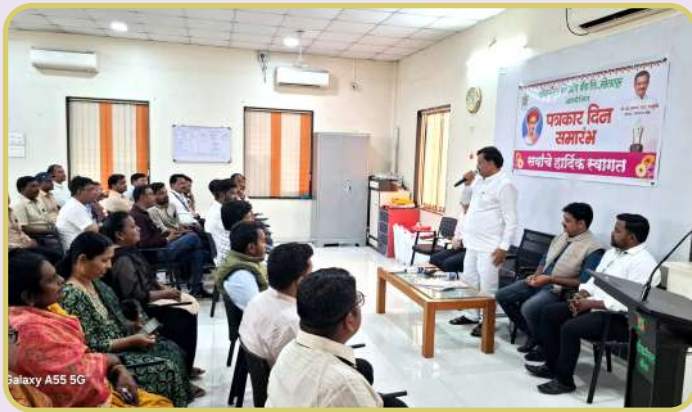
Galaxy A55 5G