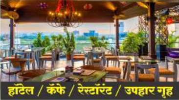
हॉटेल / कॅफे / रेस्टॉरंट / उपहार गृह

महिला सक्षमीकरणासाठी हॉटेल व्यवसाय व टुर्स अॅण्ड ट्रॅव्हल्स व्यवसायासाठी व पर्यटन विभागाशी निगडित असलेल्या सर्व व्यवसायाकरिता कर्ज उपलब्ध