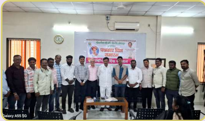
Galaxy A55 5G