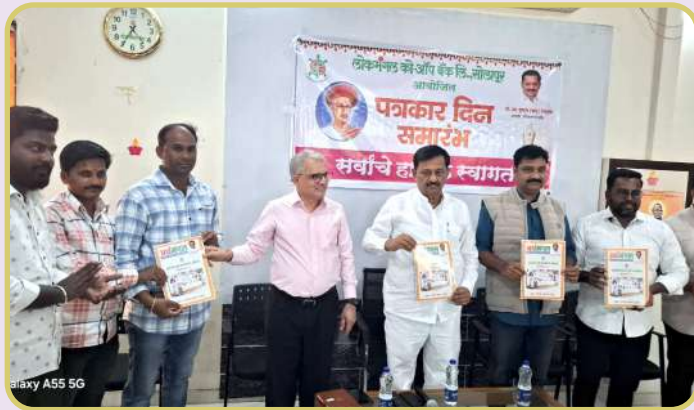
Galaxy A55 5G